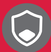
入侵偵測防禦系統(IDP)